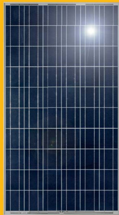
Polykristallines Modul (Detailansicht)