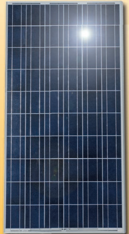
Module polycristallin (vue détaillée)