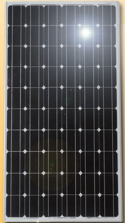
Module monocristallin (vue détaillée)