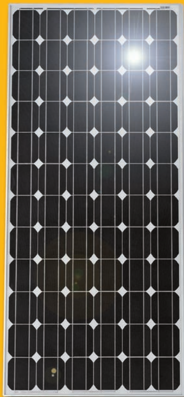
Module monocristallin (vue détaillée)